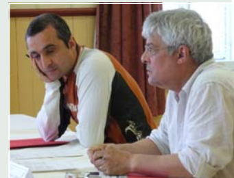
Discussions en ateliers.

Le 2 juin dernier, la station touristique de Duchesnay était une fois encore l'hôte de notre maintenant traditionnelle journée de réflexion. Cette année, deux thèmes à l'ordre du jour, visant à faire le point sur deux dossiers importants de notre vie collégiale, soit la précarité , partagée par près de 40 % d'entre nous, de même que sur l' évaluation des enseignements , vécue au collège depuis près des 10 ans.