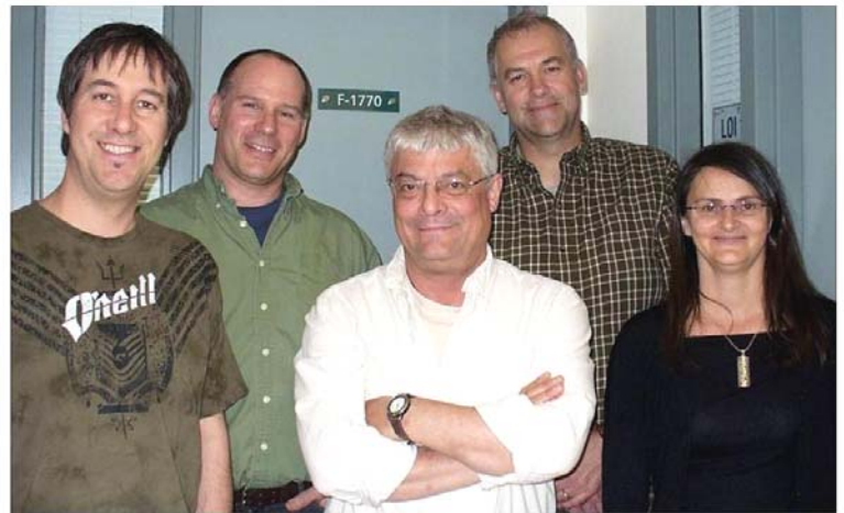
Votre exécutif 2009-2010 (plus d'infos en page 2!)

S'il nous faut reconnaître avec joie ce repos bien mérité à venir, il nous faut reconnaître aussi avec fierté le colossal travail accompli.