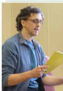
Période de questions.